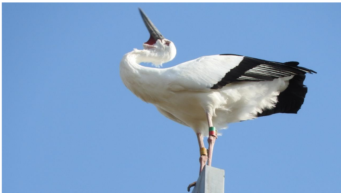
▲コウノトリ J0172 11月9日筑後市