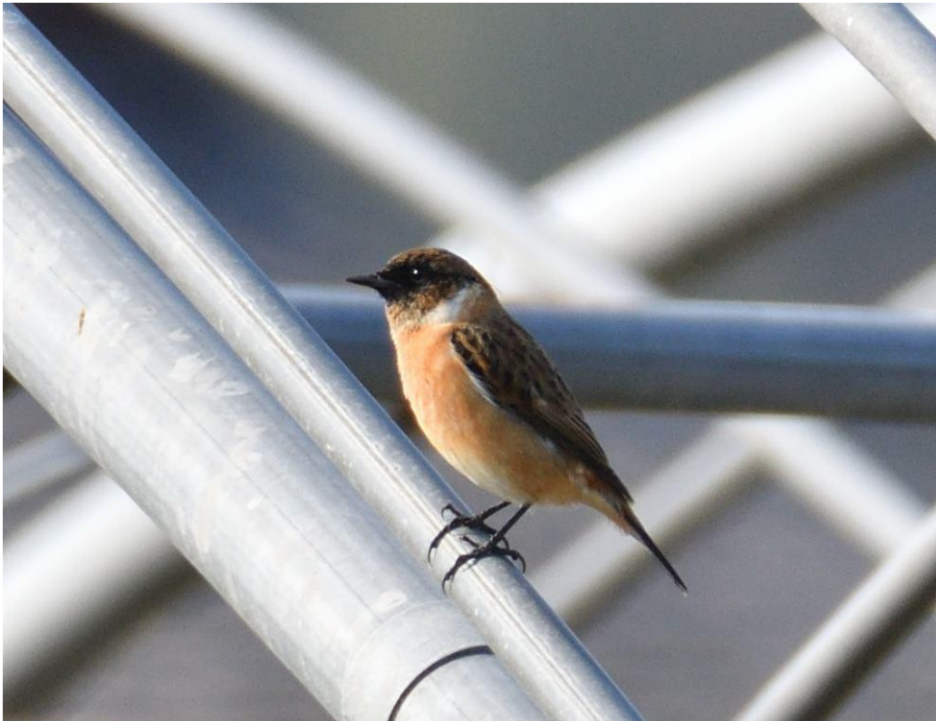
▲ノビタキ♂