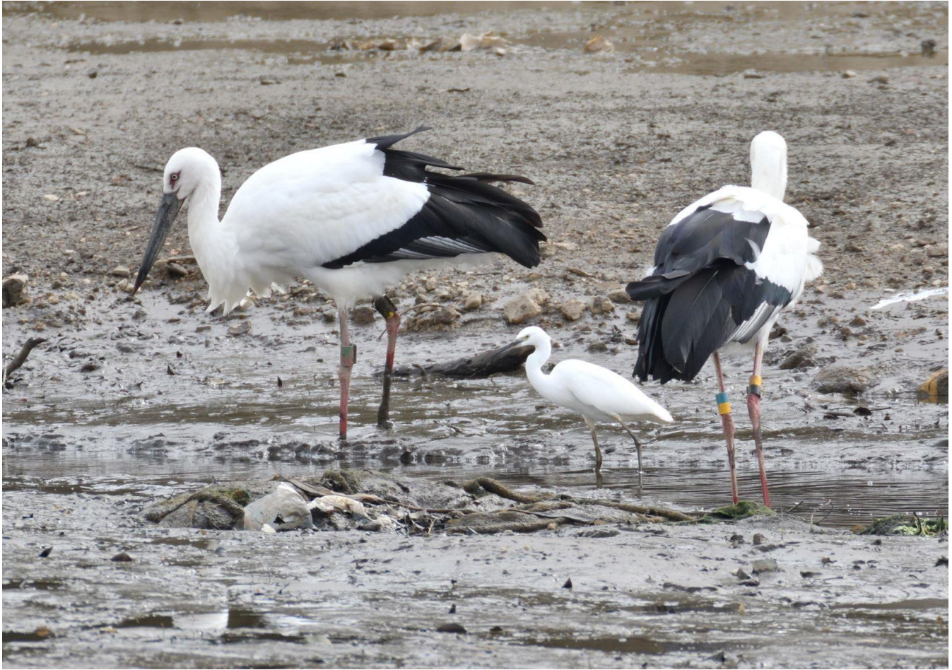
▲コウノトリ J0133 と J0172 11月11日筑後市蔵数大池