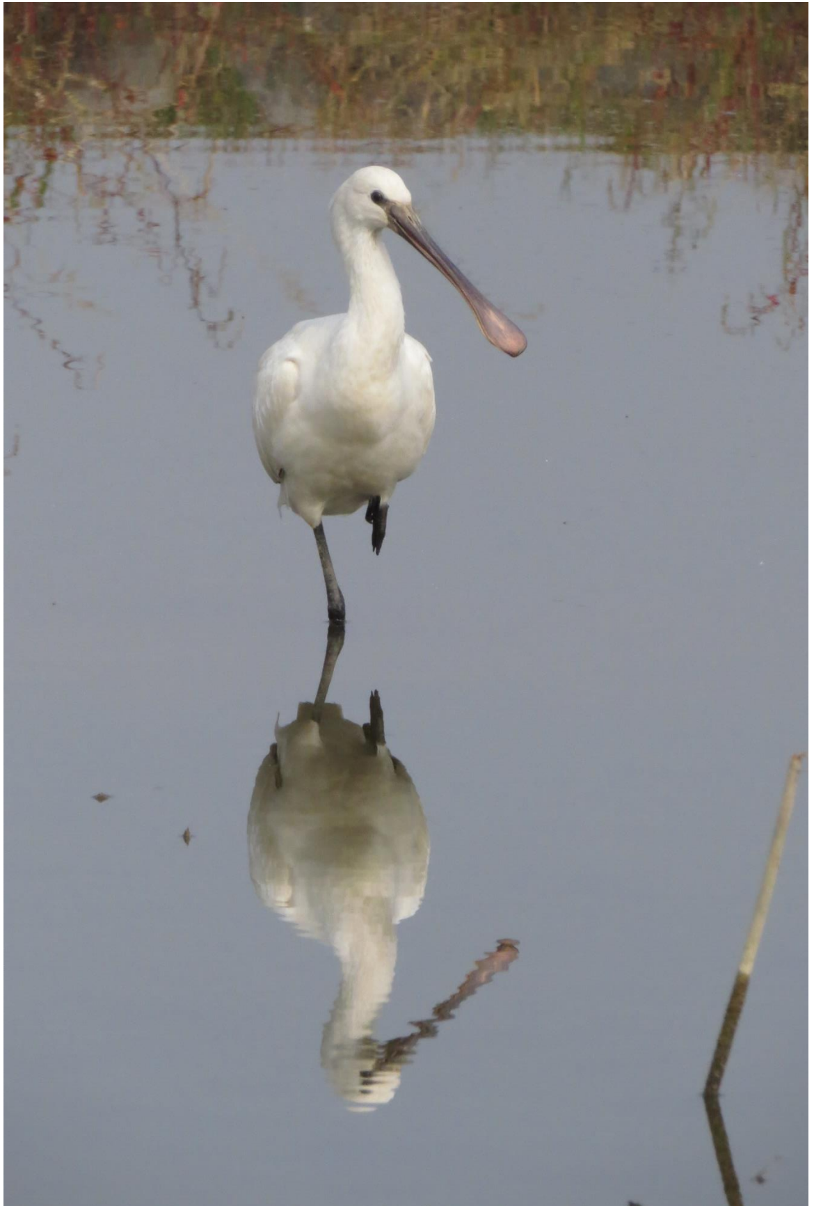
▲ヘラサギ

その他の鳥は、コガモ、ヒドリガモ、カルガモ、オカヨシガモ、ダイサギ、コサギ、アオサギ、カササギ、モズ、ジョウビタキ、ヒクイナ、ホオジロ、ムクドリでした。