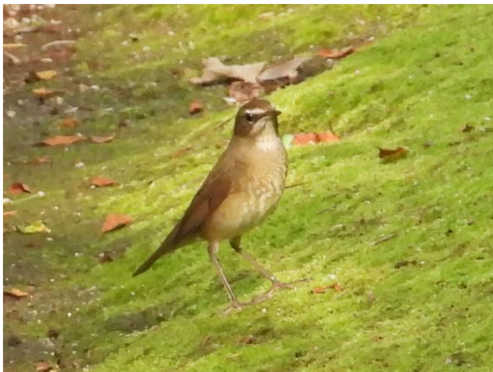
▲ノゴマ雌（春日公園）

春日市春日公園の池の両岸にはツツジの植え込みがあり、その根本から「ノゴマ雌」がサッと現れては、直ぐに植え込みに隠れてしまいます。「雌」でも旅立つ前に出会えて感激でした。又、驚いたことに、近くのヒマラヤスギ?の中に2、3羽の小さな鳥が"チラチラ"動いており、良く見ると、びっくり「キクイタダキ」でした。昨年は見る事が出来なかったキクイタダキをもう見る事が出来て感激でした。