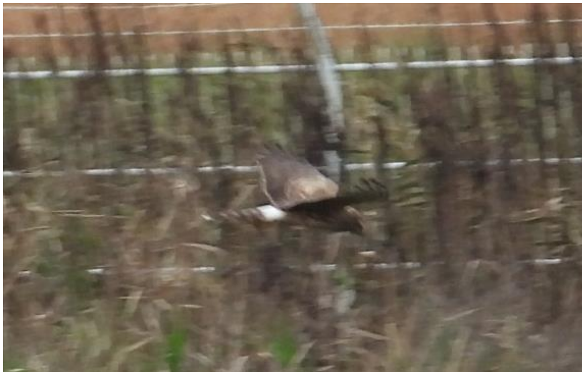
▲ハイイロチュウヒ（佐賀空港）

佐賀空港南側の堤防道路で待っていたら、現れてくれました。ハイイロチュウヒの雌だと思います。佐賀空港周辺は、昨年のような賑わいは影を潜めていますが、チョウゲンボウが現れてくれました。