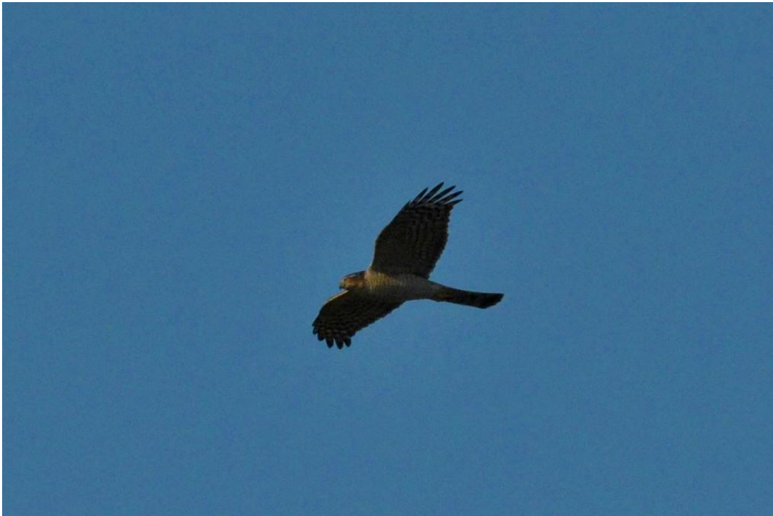
▲ハイタカ♂

蔵数大池にコウノトリを見に行きました。池に1羽と鉄塔に3羽いましたが、池で4羽そろうのは早朝と夕方でしょうか？コウノトリを見ていたら、上空にハイタカが飛んできました。青空に映えてきれいな雄でした。