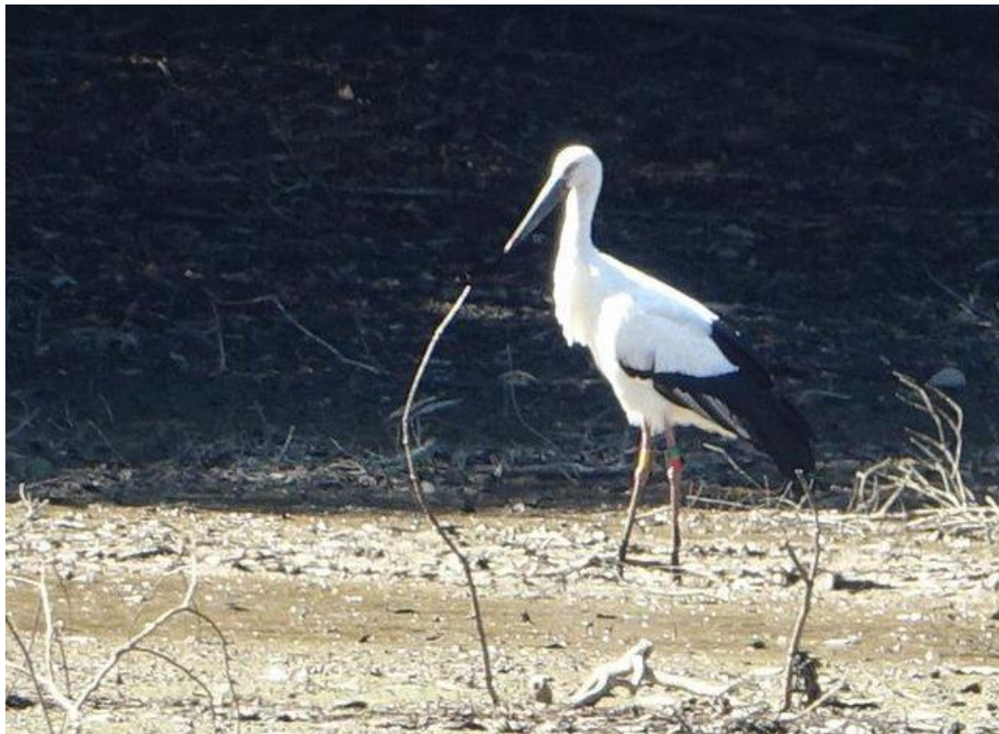
▲コウノトリ J0172 10月15日筑前町

注）左：緑赤・右：黄黄 J0172 2017.05.19 生♀個体のようです。その後、筑後市でも観察されました。