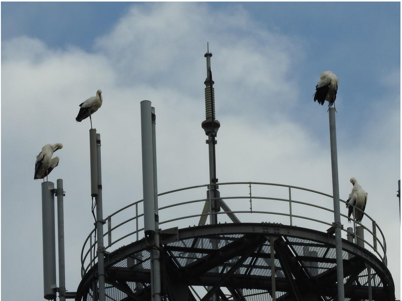
▲電波塔の上でくつろぐ4羽のコウノトリ