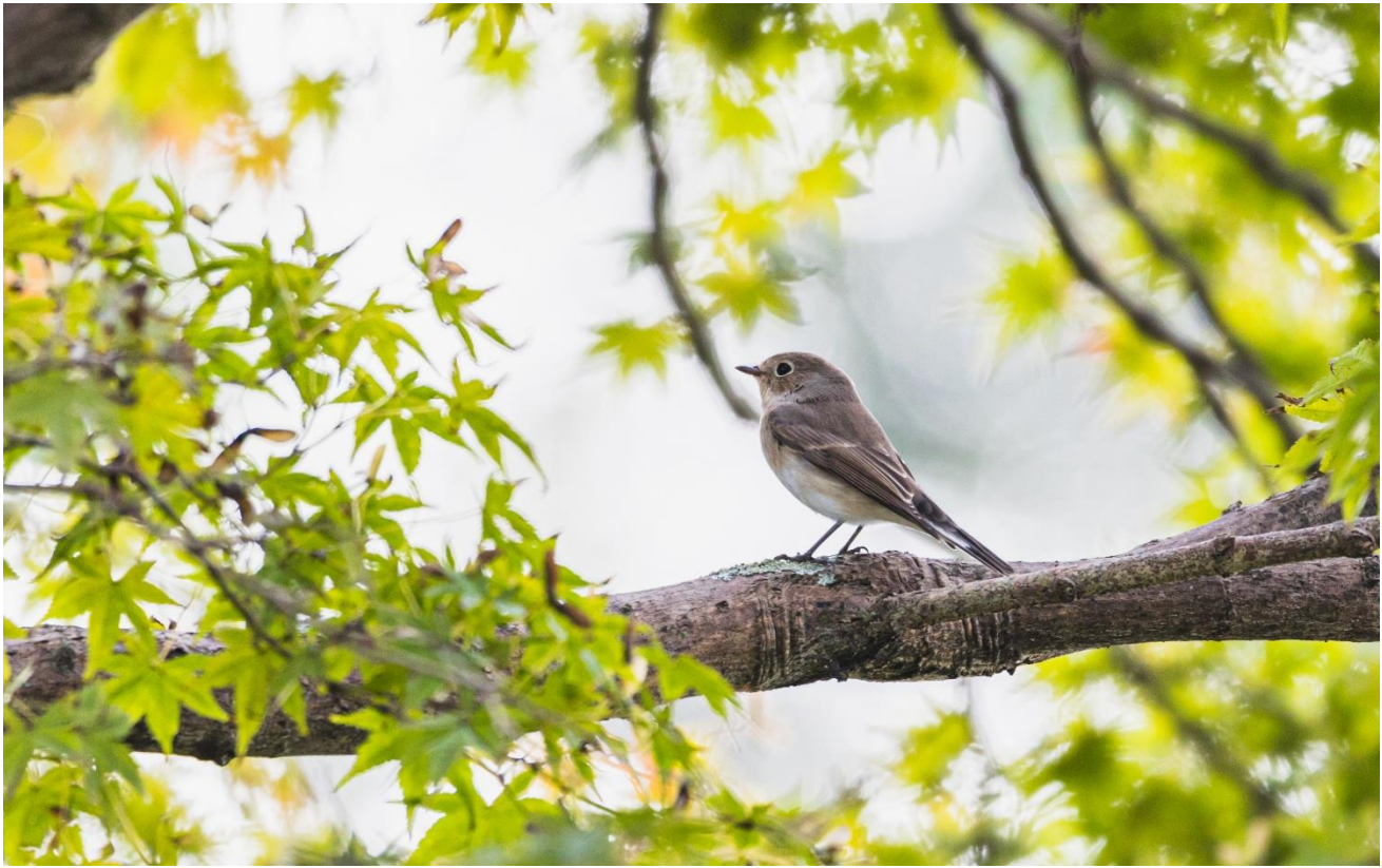
▲オジロビタキ