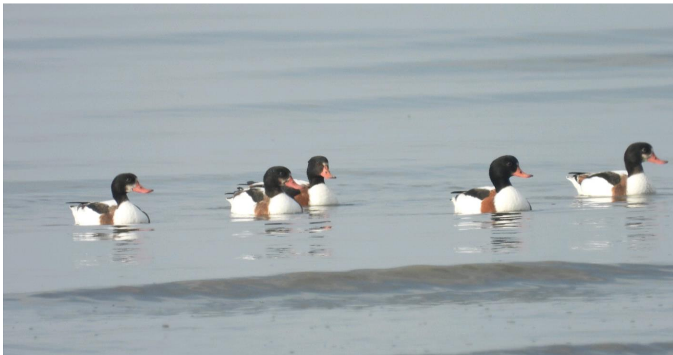
▲ツクシガモ（大授翫）

ダイゼン、ハマシギ、ホオロクシギ、ダイシャクシギ、アオアシシギ、オオソリハシシギ、オグロシギ、アカアシシギ、オバシギ、ツルシギ、シロチドリ、メダイチドリ、ミヤコドリ、セグロ・ズグロ・ユリカモメ、クロツラヘラサギ、ヘラサギなどがいました。また、ツクシガモが10羽程がゆったりと浮かんでいました。